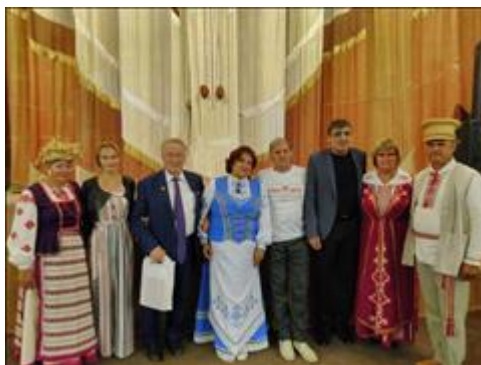
Представители белорусской культуры на Томской земле 22-25.08.2019г. - Дни белорусской культуры, делегация и представители автономий и Администрации г. Томска и Томской области

Мероприятие: Дни белорусской культуры. Всероссийская научно-практическая конференция с международным участием «Вклад белорусского народа в развитие Сибири»