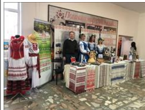
Презентация выставки и работ мастеров прикладного творчества 01.11.2019г. - презентация выставки и работ мастеров прикладного творчества в рамках проведения Конференции на базе Научной Библиотеки ТГПУ