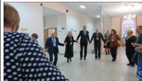
Мастер - класс по народным танцам Проведение мастер - класса в рамках Дней Белорусской культуры