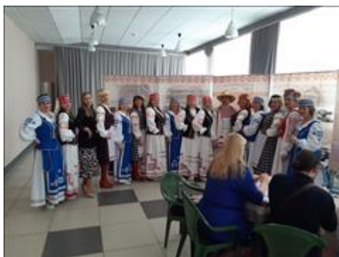
Участники Дней белорусской культуры 1-3.11. 2019г. - представители творческих коллективов проводившие культурно - образовательные мероприятия в рамках Дней белорусской культуры

Мероприятие: Дни белорусской культуры. Всероссийская научно-практическая конференция с международным участием «Вклад белорусского народа в развитие Сибири»