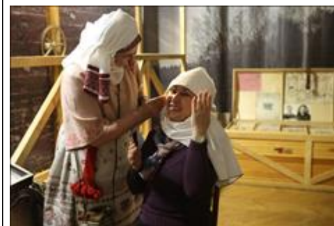
Мастер - класс "Традиционный славянский костюм"