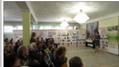
Презентация мобильной выставки Презентация мобильной выставки на базе Детско - юношеской библиотеке г. Томска 19.05.2016 г.