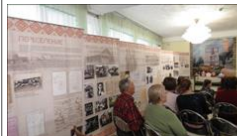
Экспонирование мобильной выставки 25.04.2019 г. Презентация выставки на базе выставочного комплекса "Белорусская хатка" г. Томск