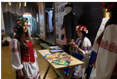
Мастер-класс по прикладному искусству