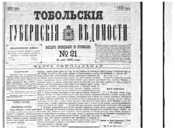
Газета «Тобольские губернские ведомости», №21 за 23 мая 1900 г.

Но посёлка Осиновского (деревню Осиновку) мы в этой книге не нашли. Поиски продолжались, и архивы открыли нам тайну его образования. Не стану утомлять читателей длинным рассказом о его поиске, лишь скажу, что посёлок Осиновский, находящийся, как и Еловочка, всего в двух верстах от Ермаковского, оказался не в Каргалинской, где мы его упорно искали, а в соседней, Слободчиковской, волости Тарского уезда. Это выяснилось благодаря совершенно неожиданной записи, обнаруженной нами в одной из следующих книг «о льготных переселенцах...»: «По журналу Общего присутствия Тобольского Губернского Управления от